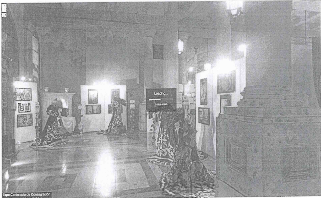
Expo Centenario de Consagración Autor Sistema Nacional de Información Cultural